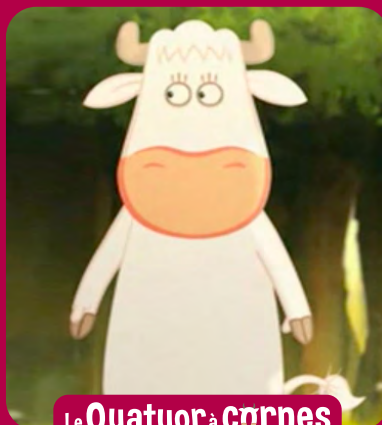
Le Quatuor à cornes