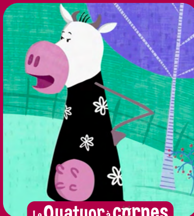
Le Quatuor à cornes