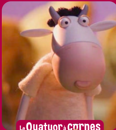
Le Quatuor à cornes