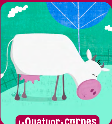
Le Quatuor à cornes