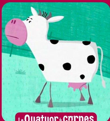
Le Quatuor à cornes