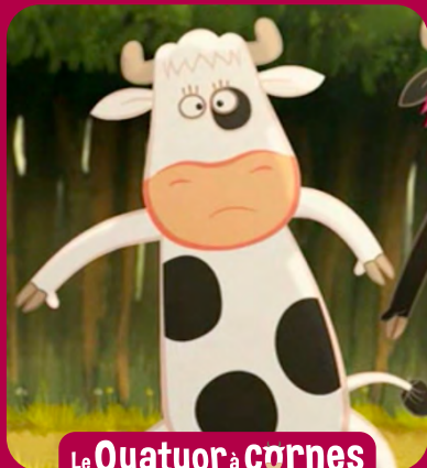
Le Quatuor à cornes