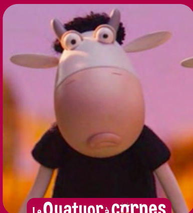
Le Quatuor à cornes