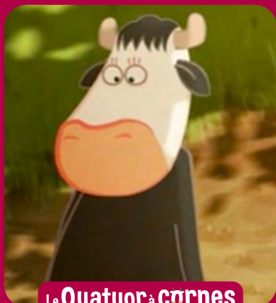
Le Quatuor à cornes