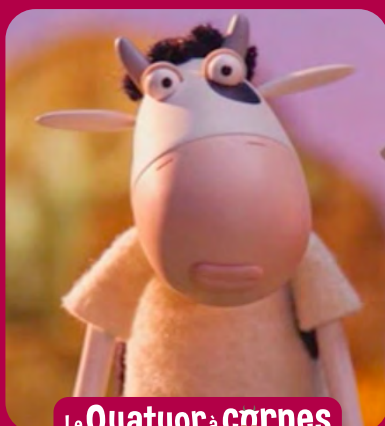
Le Quatuor à cornes