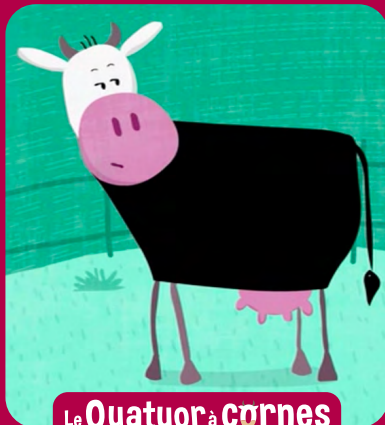
Le Quatuor à cornes