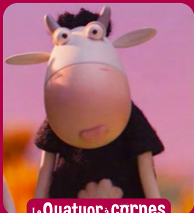
Le Quatuor à cornes