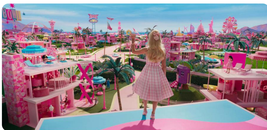
Barbie dans son monde parfait

englué dans le néolibéralisme et ses « valeurs ». On y trouve des femmes noires, asiatiques, handicapées, catégories de personnes minorisées à différentes échelles au sein du système capitaliste. Le film fait du tokenisme 17 , parce qu'il « visibilise » les « invisibles » à la manière d'une collection, pour cocher des cases, sans que ces personnages n'aient de caractérisation ou de rôle à part entière et comme si les rapports de pouvoir entre ces catégories n'existaient pas. Et puis, les corps « autres » ne sont finalement jamais tant autres que ça, ils sont eux aussi rentrés dans les cases lisses que propose le monde de Barbie. Finalement, le film ne cesse de nous enfermer dans son rêve de rose absolu « où tout le monde peut être comme il veut », c'est-à-dire où tout le monde peut avoir « sa propre maison, sa propre voiture, sa propre carrière 18 », où les hommes seraient gentils et toujours beaux (comme les femmes aussi), dans un monde aseptisé et homogène, domestiqué au bon vouloir du capitalisme. A coup de slogans creux, Barbie veut réconcilier tout le monde pour que tout le monde soit heureux dans un monde de plastique rose.