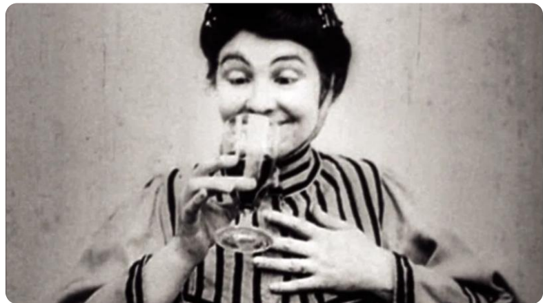
Image issue du film Madame a des envies d'Alice Guy