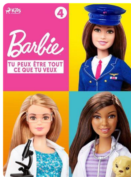
Image de la pub Barbie en 2015

Barbie, sa marque et le film qu'il a produit, surfent ainsi sur un type de féminisme qui s'accommode très bien du capitalisme voire même qui le sert. Le combat féministe est individualisé, réduit à des questions de représentations et d'affirmation personnelle et fait fi de tous les rapports de domination qui se jouent dans le système économique. Quelle est la place des femmes dans ce système ? Comment celui-ci exploite les femmes ? Exploite-t-il toutes les femmes de la même manière ? Pour le film Barbie , tout est une question de choix et de mauvais comportements des hommes, comme si les barrières structurelles conditionnant le maintien du système économique n'existaient pas.